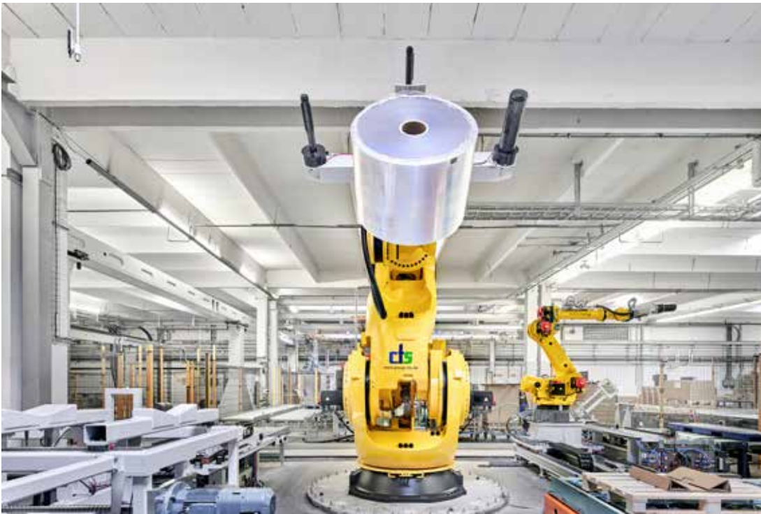
Wegen der hohen Stückgewichte bis 1,5 t kommt ein Schwerlastroboter M-2000iA/2300 von Fanuc mit 2,3 t Traglast bei Klöckner Pentaplast zum Einsatz.

sche Geräte-, Lebensmittel-, Elektronik- und Konsumgüterverpackungen sowie für Druck- und Sonderanwendungen. Mit einem breiten und innovativen Portfolio an Verpackungs- und Produktfolien und Dienstleistungen spielt Klöckner eine wichtige Rolle in der Wertschöpfungskette seiner Kunden, indem es die Produktintegrität sichert, den Ruf der Marke schützt und die Nachhaltigkeit verbessert. Das 1965 gegründete Unternehmen verfügt über 31 Werke in 18 Ländern und beschäftigt mehr als 5.900 Mitarbeiter, die an über 60 Standorten global für Kunden tätig sind.